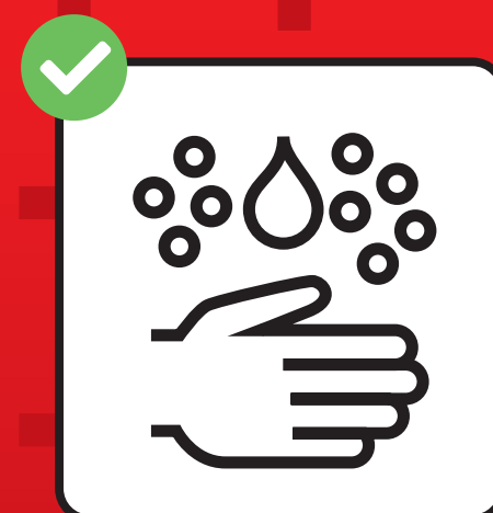
Rispettare le norme igieniche.