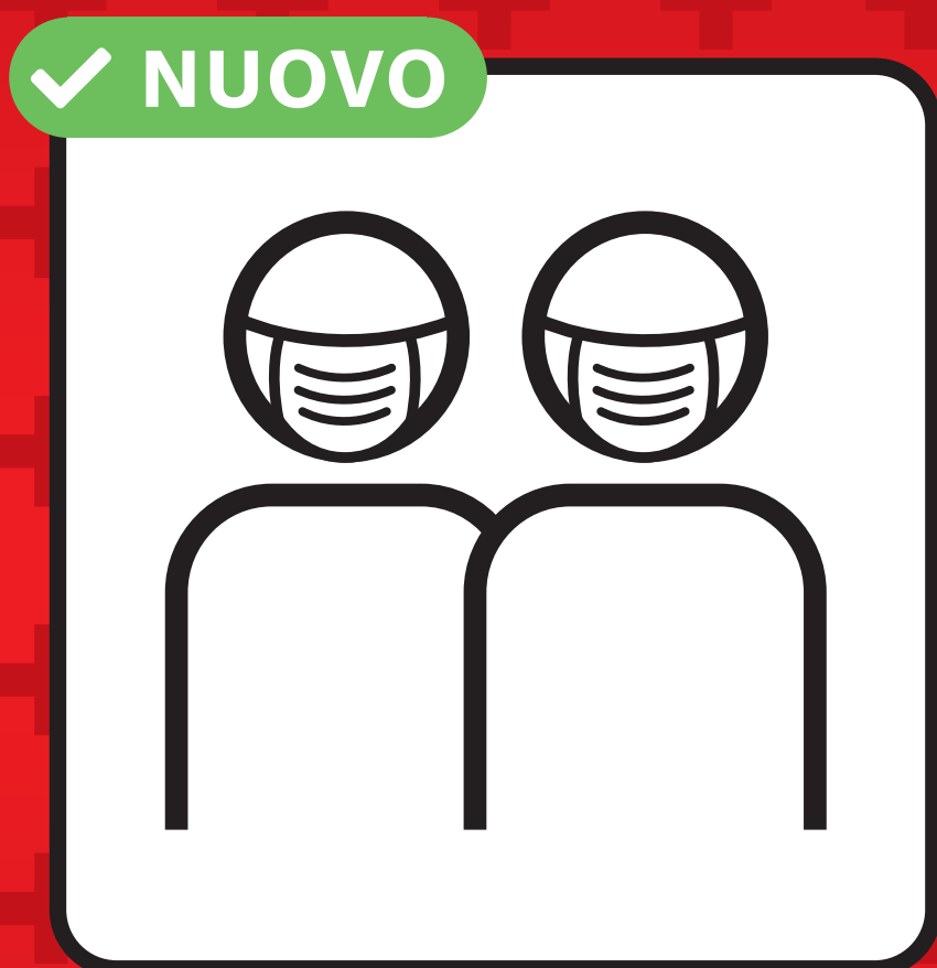
Indossare la mascherina.