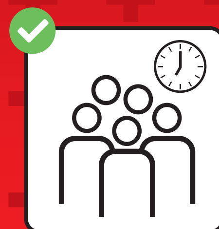
Evitare le ore di punta.