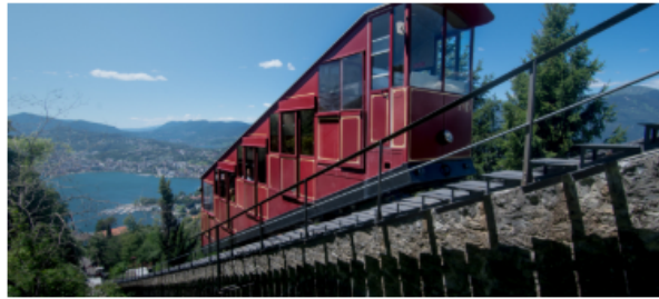
Le rosse tomano in vetta di notte