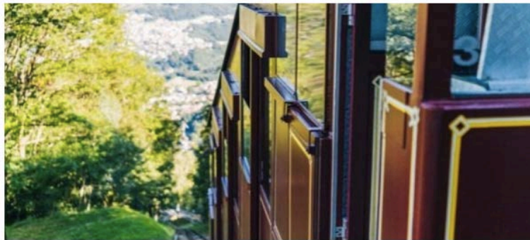
Funicolare Monte Brè